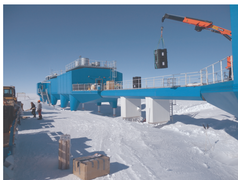
Obr. 2: Výskumná stanica Halley