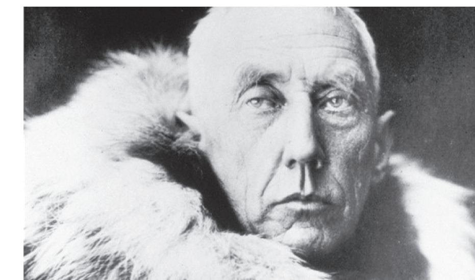
Obr. 1: Roald Amundsen