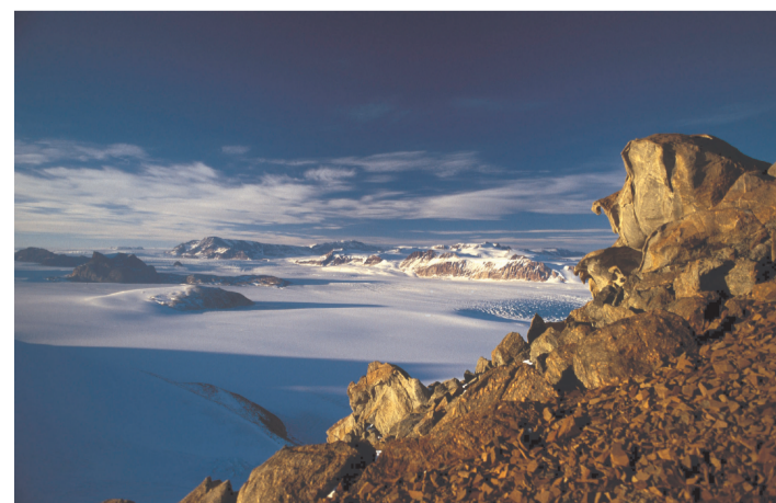
Obr. 3: Transantarktické pohorie

Vysvetlivky - južný geomagnetický pól - pól nepravideľného magnetického poľa Zeme vypočítaný za predpokladu, že sa v strede Zeme nachádza tyčový magnet - južný magnetický pól - bod, v ktorom magnetické siločiarly magnetického poľa Zeme stoja vertikálne k povrchu Zeme - pól nedostupnosti - miesto, ktoré je najťažšie dosiahnuteľné vzhľadom k svojej polohe, miesto, ktoré má najväčšiu vzdialenosť od oceánu obklopujúceho Antarktídu